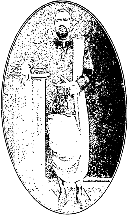
श्रीरामकृष्ण परमहंस देव